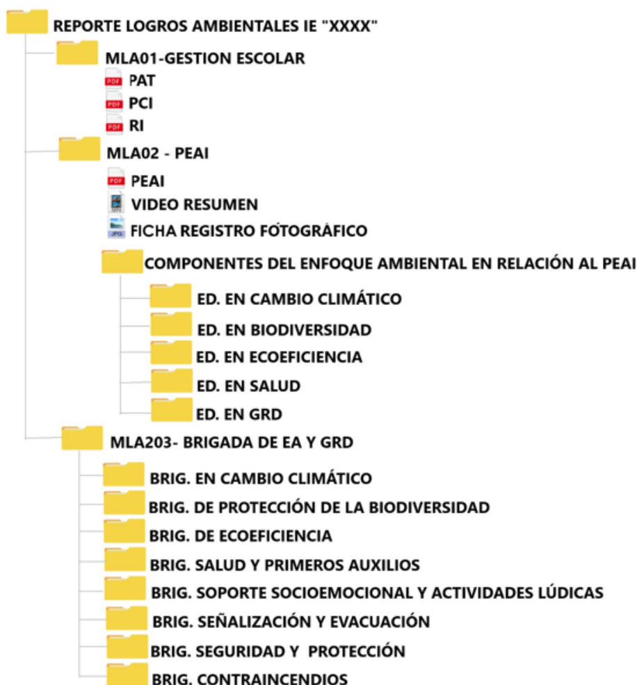
Ilustración 1. ORDEN PARA LA ORGANIZACIÓN DE LAS EVIDENCIAS.